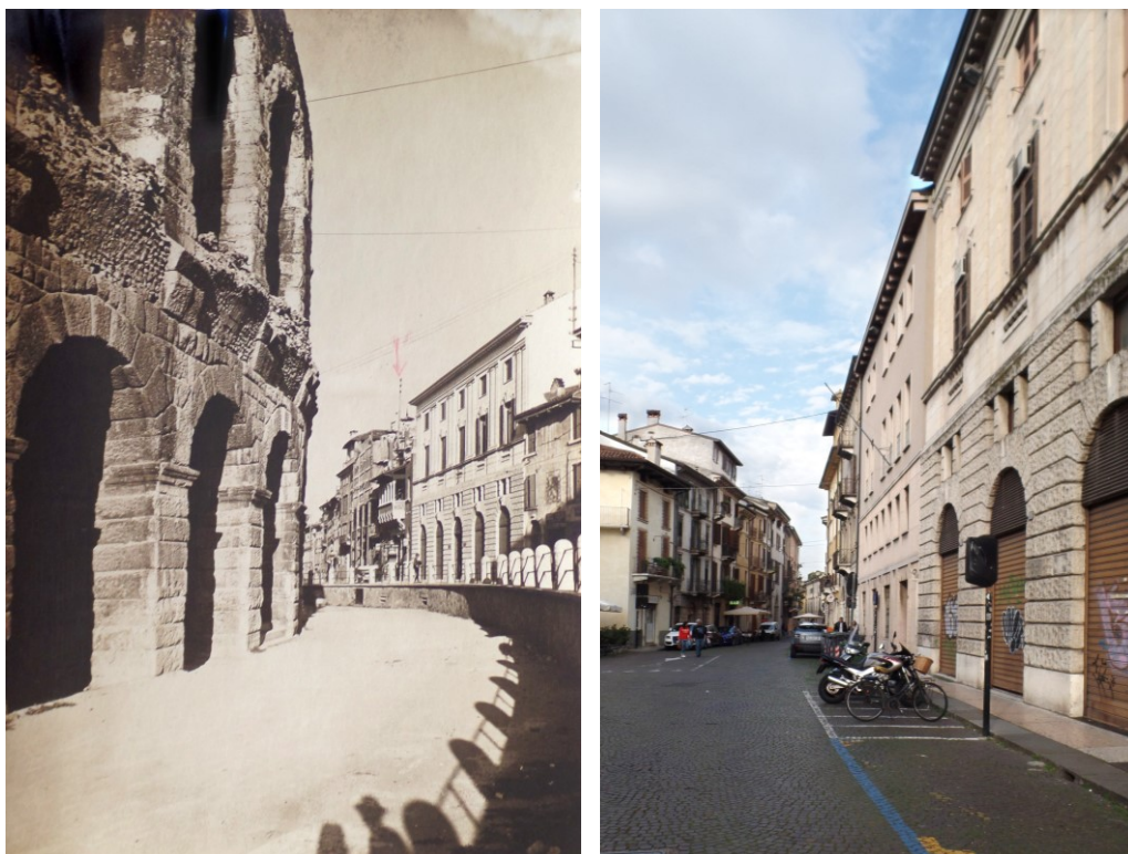
Figg. 6-7. Veduta dell'autorimessa nel 1926 (ACS, DGBAA II, b. 22) e situazione attuale a confronto.