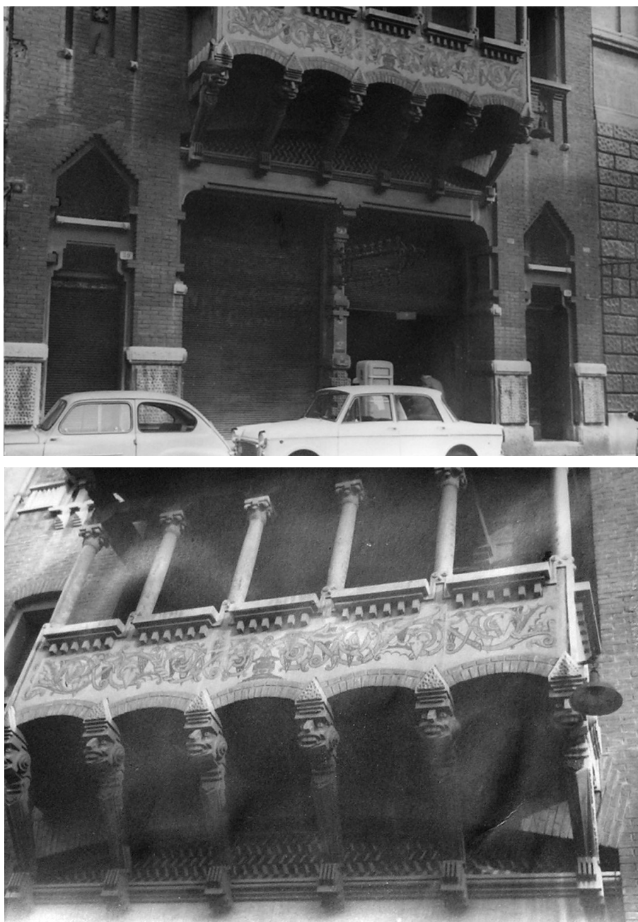
Fig. 4. Il garage di via Leoncino progettato da Aldo Goldschmiedt: in questa foto sono ben visibili l'ingresso, la pompa di benzina, i mensoloni zoomorfi e i diversi materiali utilizzati in funzione decorativa.