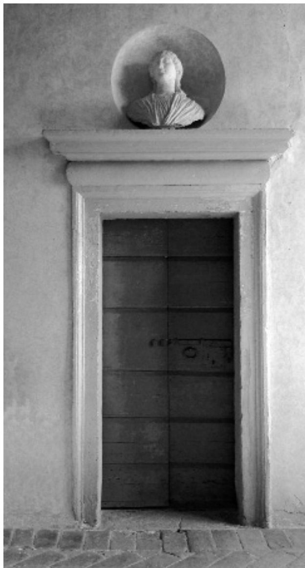
Villa Della Torre a Fumane: teste di gesso all'antica (xvi secolo).

In realtà, i due inventari sono di particolare interesse, sia perché consentono di verificare lo stato del fidecommesso all'inizio e alla fine del XVII secolo, permettendo di valutare l'efficacia della primogenitura in rapporto ai beni mobili, sia perché a un'attenta lettura le due carte d'archivio si dimostrano, almeno in parte, complementari. La considerazione di queste carte insieme ai quattro inventari seicenteschi relativi al palazzo di città, inoltre, consente di ricostruire, come si vedrà, la vicenda di alcuni traslochi di beni da Verona alla Valpolicella.