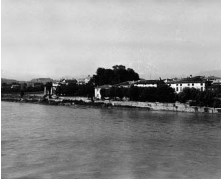
L'Adige a Settimo di Pescantina.

dal fiume alle montagne, dalla bassa Valpolicella alle colline moreniche del Garda, al Baldo, ai monti delle Prealpi bresciane, col frastagliato profilo.