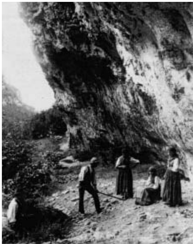
Scavi De Stefani alle Scalucce di Molina.