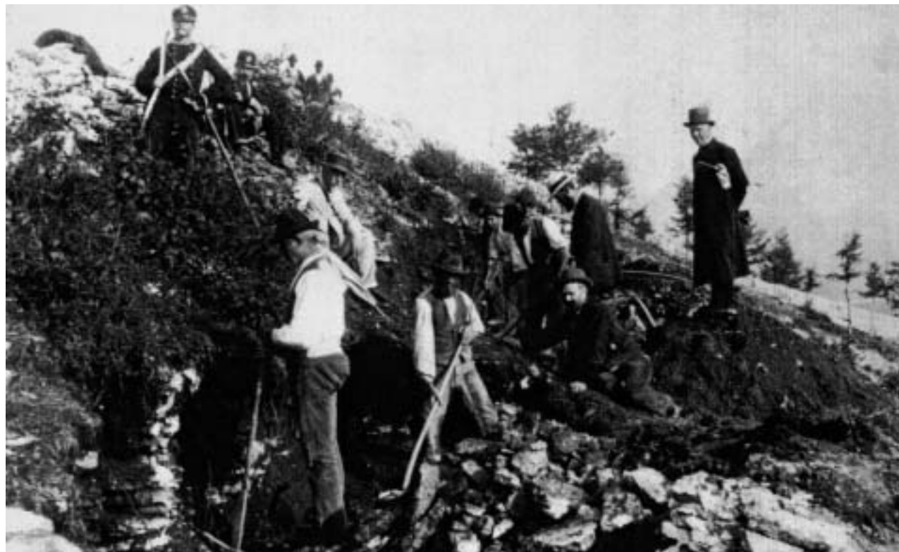
Scavi De Stefani a Sant'Anna d'Alfaedo (Archivio De Stefani, Verona).

Del sito di Scalucce è stata in particolare presentata da Leone Fasani la documentazione inedita degli scavi di verifica condotti da Mortillet dopo gli interventi di De Stefani, mentre della Grotta di Fumane si è occupato Alberto Broglio, che con i suoi collaboratori ha riferito dei ritrovamenti avvenuti durante le campagne di scavo del 1999, in particolare di due frammenti della volta decorati con figure animali e umane. La datazione, fissata in un periodo attorno ai 35 mila anni fa, ha permesso di definirle come la pri-