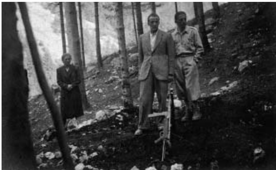
Riesumazione della salma di un partigiano nelle colline della Valpolicella all'indomani del 25 aprile 1945.

prio ambiente. L'attenzione verso la storia locale, che non è certamente storia minore, permette infatti una conoscenza diretta del passato attraverso il recupero di testimonianze orali e la lettura, la comprensione, il confronto e la classificazione dei documenti e dunque consente di ricreare, sia pure in ambito più circoscritto, la stessa metodologia degli storici.