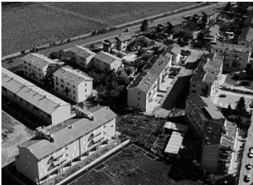
Nuove costruzioni lungo la strada provinciale all'altezza dell'abitato di Parona.

ancora molto alta e di integrare invece questa presenza vegetazionale con il rimboschimento e interventi di de-cementificazione nella parte bassa.