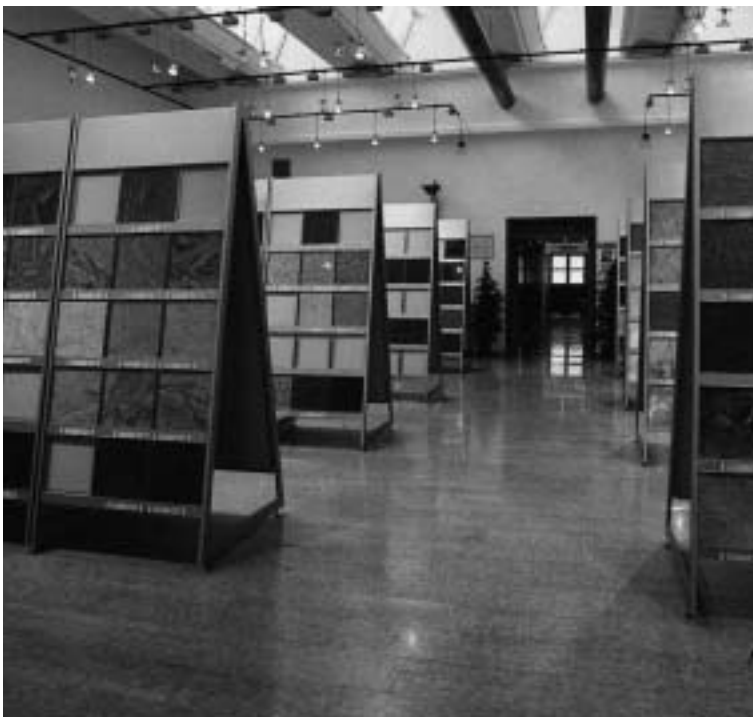
Due sale della Videomarmoteca.