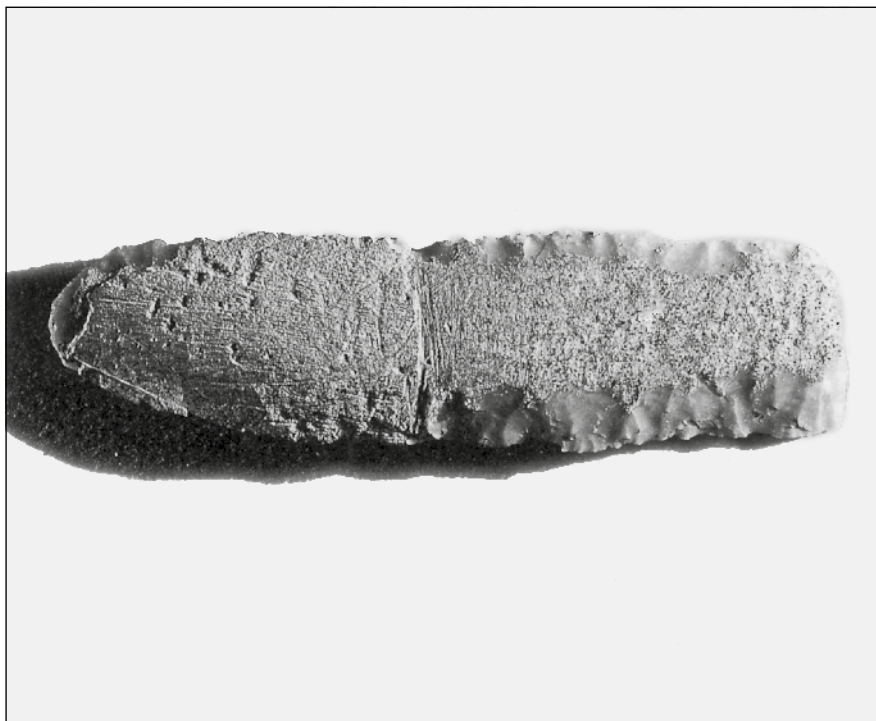
«Lama-coltello» (spezzata nella porzione distale) da Còal del Bòta di Vaggimal (S. Anna Alfaedo).

si sono rinvenute due punte di freccia conservanti su una faccia porzioni di cortice abraso/levigato (BARFIELD, CHELIDONIO, pp. 67-76). Ulteriori riferimenti si hanno tra l'industria litica di insediamenti della Ceramica Lineare Occidentale nell'ambito culturale del Rubanè e del Gruppo di Blicquy in Belgio, (CAHEN, CASPAR, OTTE, 1986, p. 18), dove però la tecnica di abrasione totale del cortice è stata interpretata come derivante da una sommaria pulitura di crete o argille inglobanti le masse silicee nelle giaciture di raccolta e/ o scavo primari.