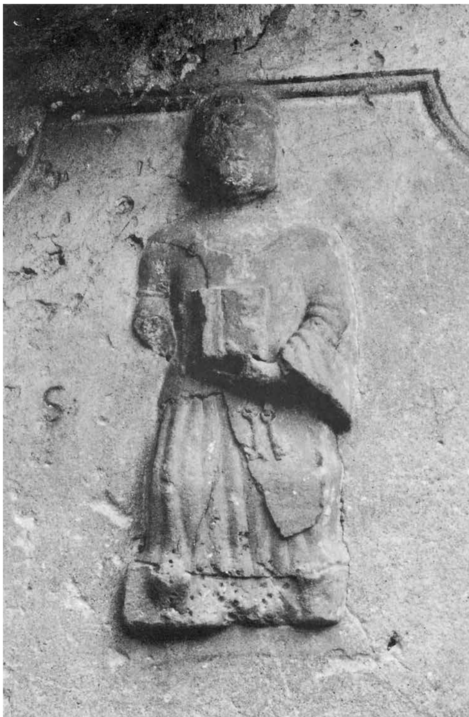
L'immagine di San Pietro sul corpo laterale sinistro della chiesa.