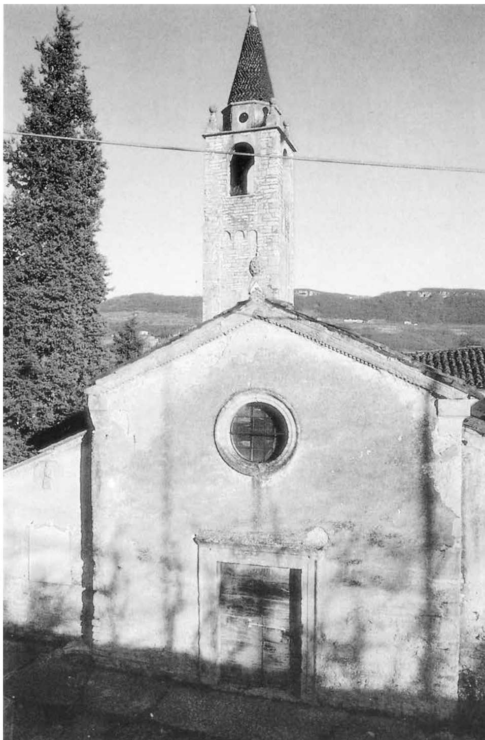
La facciata e il campanile della vecchia parrocchiale di Torbe.