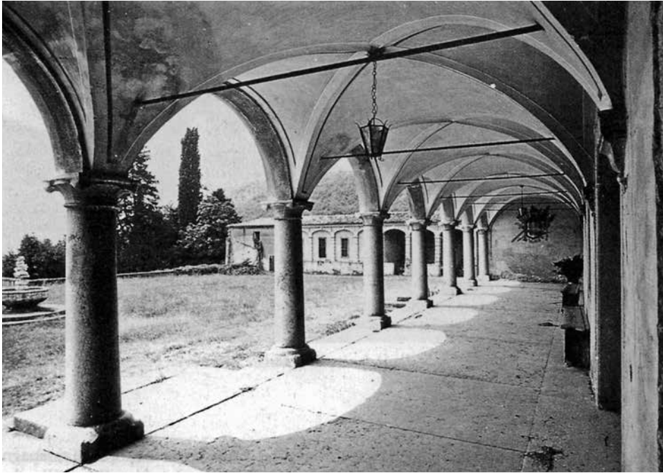
Villa Bertoldi di Negrar: un aspetto del porticato.