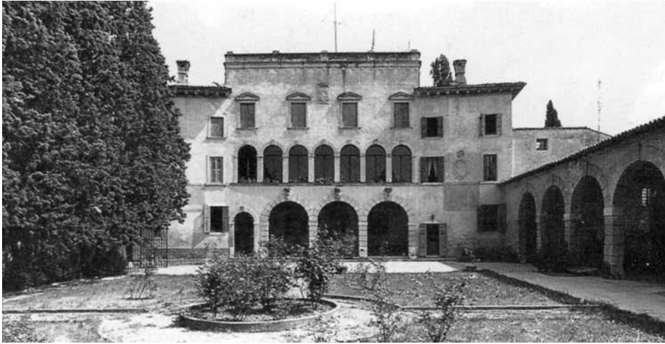
Villa Turco Zamboni di Arbizzano nella Valpolicella orientale.

sede della famiglia sobria e pudica, che sceglie la dimora di campagna per risparmiare, per vivere con oculata «masserizia». «La festa sotto l'ombra ragionarti piacevole del bue, della lana, delle vigne e delle sementi, senza sentire romori, o relazioni, o alcuna altra di quelle furie, quali dentro alla terra fra cittadini mai restano: sospetti, paure, maldicenze, risse, e l'altre bruttissime a ragionarne cose, e orribili a ricordarsene». L'altre bruttissime a ragionarne cose sono quelle che condurranno Machiavelli in quel suo poderetto di San Casciano in Val di Pesa, a meditare sul potere: come si conquista, come si mantiene e come si perde.