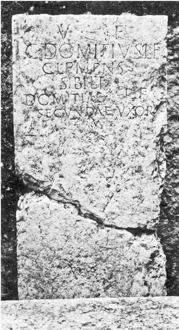
Fig. 4: Verona, Museo Archeologico al Teatro Romano: la stele di C. Domitius Clemens.

Si tratta (fig. 4) di una grossa stele rettangolare, priva di decorazioni e di corniciatura, sommariamente levigata sulla fronte e lungo i fianchi e appena sbazzata a scalpello nella parte posteriore.