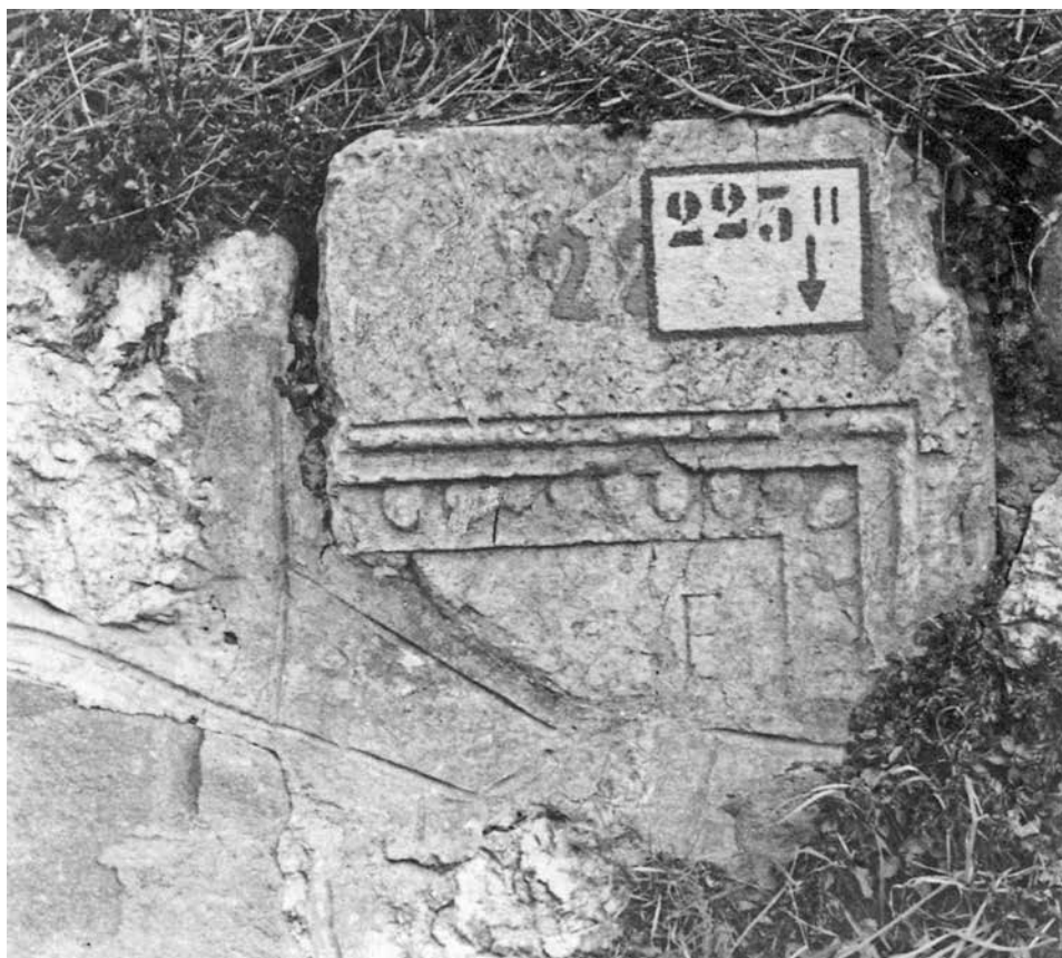
Fig. 5: Ca' Rotta di Peri: frammento di ara funeraria con iscrizione.

di discendenti da liberti della medesima gens (in questo caso la Domitia ) oppure di individui legati fra loro da vincoli di parentela non così stretti da impedirne il matrimonio (68) .