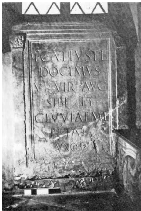
Fig. 1: Avio: Casa Bresavola: la stele di T. Catius Docimus.