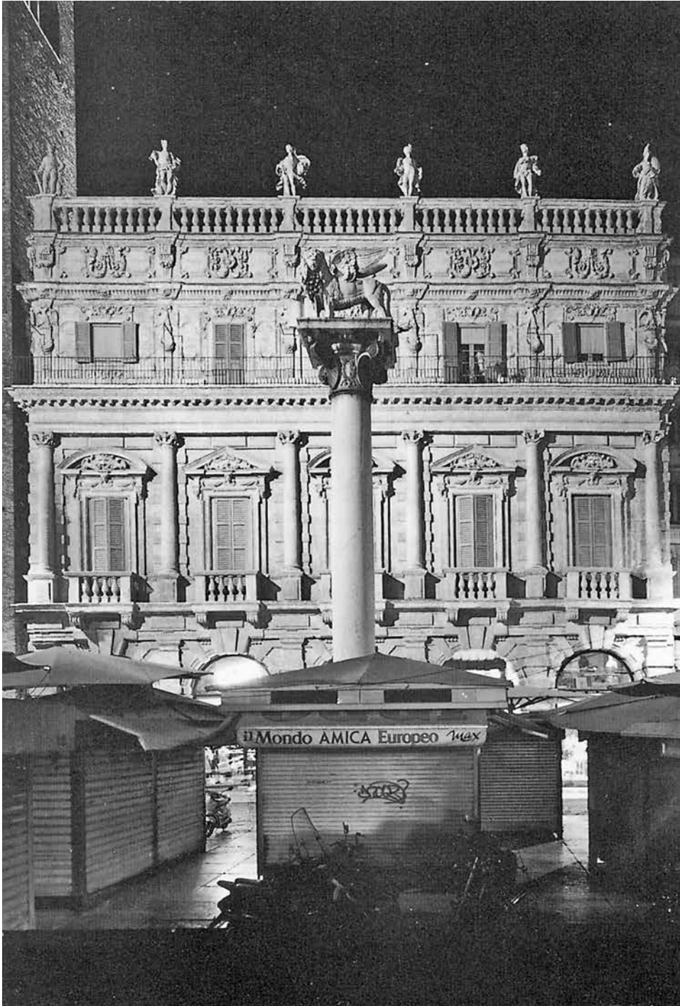
La facciata del palazzo che fu dei Maffei (e oggi proprietà delle Assicurazioni Generali) e fondale della piazza delle Erbe a Verona.