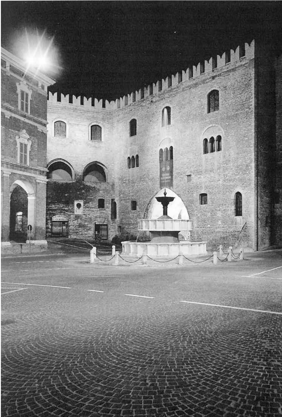
La fontana Sturinalto a Fabiano nelle Marche, «fiore di pietra nella città della carta», la cui prima erezione risalirebbe al 1285.