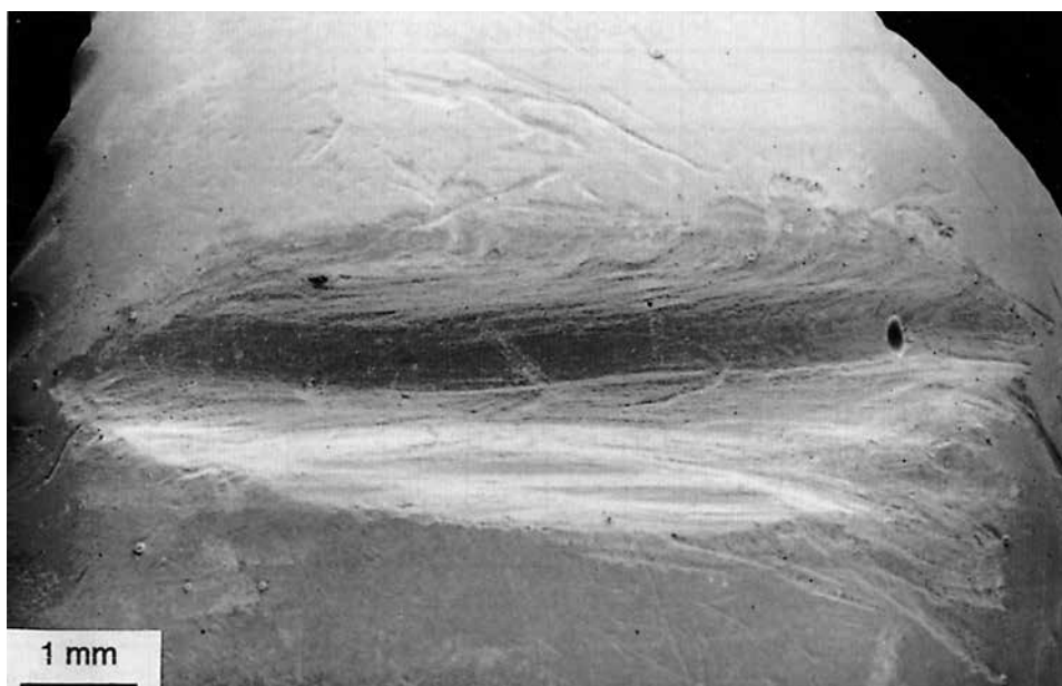
Fig. 2. Grotta di Fumane. Perforazione incompleta ottenuta tramite sciage su un frammento di Luria cf. lurida (nota come ciprea ). La fotografia alla scansione elettronica evidenzia le strie lasciate da uno strumento litico durante il «movimento di va e vieni»; queste sono evidenti, ripetute e hanno tutte la medesima direzione.

leggermente più elevato. Il lavoro di determinazione ha portato all'identificazione sia di specie già presenti nella collezione, sia di 4 nuove specie, rappresentate ognuna da un solo esemplare. Si tratta di 3 specie appartenenti ai gasteropodi ( Patella cf. caerulea , Smaragdia viridis e Mitra cf. cornicula ) e una ai bivalvi ( Mytilus sp.); la loro distribuzione geografica è molto ampia e può identificarsi con l'intero bacino del Mediterraneo. Per quanto riguarda i rispettivi habitat, Patella caerulea (L., 1758) vive su substrati rocciosi nei piani medio e infralitorale, fino a 10 metri di profondità; Smaragdia viridis (L., 1758), caratterizzata dalla colorazione verde brillante, vive solitamente nel piano infralitorale sulle alghe verdi o sulle Fanerogame marine; Mitra cornicula (L., 1758) è presente su fondali mobili infralitorali; infine gli individui appartenenti al genere Mytilus vivono nel piano infralitorale attaccati tramite un bisso molto muscoloso su substrati duri (solitamente scogli e rocce).